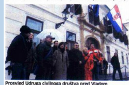
Prosvjed Udruga civilnoga društva pred Vladom

ZAGREB – Hrvatska još nije spremna zatvoriti poglavlje 23 (pravosuđe) u pregovorima s Europskom unijom, smatra 15 nevladinih organizacija koje se bave zaštitom i promicanjem ljudskih prava, a koje pripremaju izvještaj u sjenu za spomenuto područje