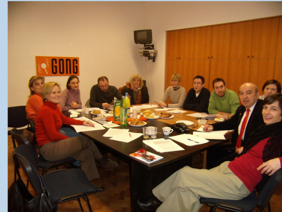
27 janar 2011 – takimi i parë formal në GONG